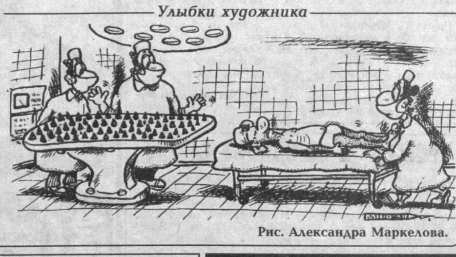
Рис. Александра Маркелова.

батывают гормон инсулин, регулирующий содержание глюкозы в организме. Странно осложнение сахарного диабета как острое (например, кома, состояние с потерей сознания, приводящее подчас к смерти), так и не острое, например, диабетическая ретинопатия - поражение сетчатки глаза вплоть до необратимой слепоты, поражение венечных сосудов сердца, диабетическая гангрена нижних конечностей. С осложнениями диабета бороться можно и нужно. Недавно в России появился препарат "Вессел Дзу Ф", обладающий ярко выраженным тромболитическим действием. В европейских странах этот препарат успешно применяется с 90-х годов. Однако гораздо более важным является изыскание путей профилактики и излечения собственно сахарного диабета. Обобщая результаты на этом пути удалось получить с помощью биологически активной добавки к пище "Инулин". В клубнях некоторых растений (в частности в клубнях топинамбура, известном больше как земляная груша) содержится полисахарид инулин, являющийся природным регулятором сахара в крови. Экстрагированный из топинамбура по новейшей технологии, полисахарид составляет основу биоактивной пищевой добавки