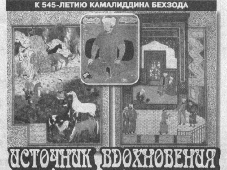
К 545-ЛЕТИЮ КАМАЛИДИДИНА БЕХЗОДА

себя несравненным мастером композиции, насыщенной огромным числом персонажей, с богатым архитектурным фоном или ландшафтом. Шедевром кисти Бехзода считаются иллюстрации к "Бустону" Саади, сохраняемые в Каире. В этих произведениях он предстает как тонкий лирик. Эта черта получает развитие в романтических сценах, посвященных влюбленным. Иллюстрируя "Хамсу" Низами и