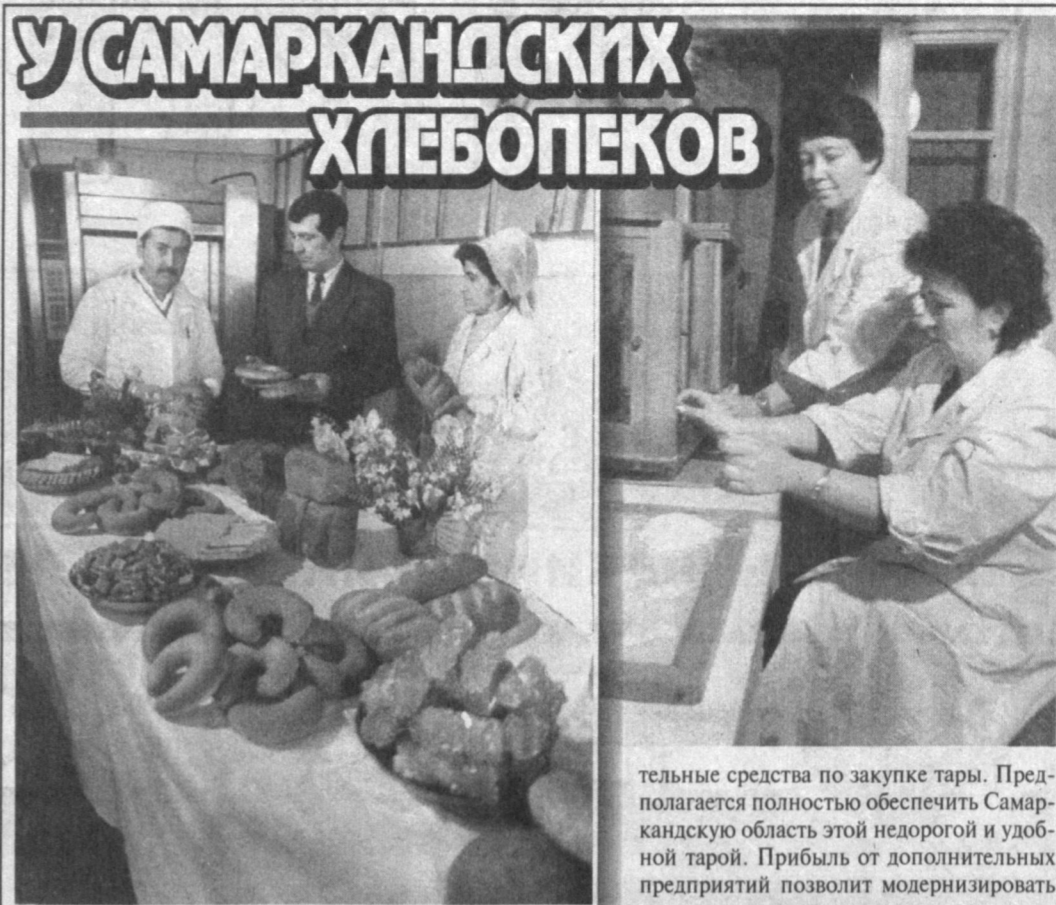
С переменной формой собственности заметно активизировали свою деятельность предприятия акционерного общества "Самаркандобхлебопродукт".

С переменной формы собственности заметно активизировали свою деятельность предприятия акционерного общества "Самаркандобхлебопродукт". Проведено переоснащение мелькомбинатов в Джамбасе и Акташе, на многих хлебопекарнях установлены высокоэффективные германские и турецкие автоматические линии. Работа по совершенствованию производства ведется в соответствии с запросами рынка на различные изделия. Так, на совместном узбекско-американском предприятии "Янги замон" начался монтаж оборудования для изготовления восточных сладостей, готовятся хлебобулочные изделия. На головном предприятии АО решено установить оборудование для получения полипропилена, необходимого для изготовления легких и прочных мешков. Новое производство сэкономит значи-