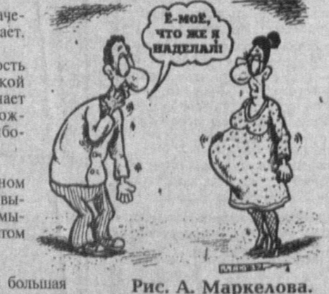
Рис. А. Маркелова.

обнаружил в печатных изданиях Станислав Алтунянц. В воздухе пахнет разлукой. Тучи рыдают слезами. Гармония звуков порождает гармонию света. Каламбуры-ляпы обнаружил в печатных изданиях Станислав Алтунянц. В воздухе пахнет разлукой. Тучи рыдают слезами. Гармония звуков порождает гармонию света. Каламбуры-ляпы обнаружил в печатных изданиях Станислав Алтунянц. В воздухе пахнет разлукой. Тучи рыдают слезами. Гармония звуков порождает гармонию света.