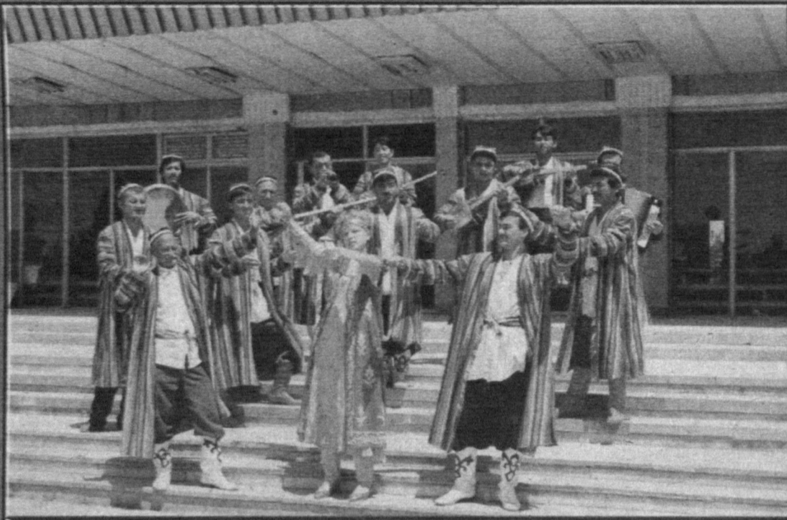
Управление по делам культуры Сырдарьинской области уделяет большое внимание развитию народного творчества в городах и районах края. НА СНИМКЕ: ансамбль Дворца культуры Гулистанского района, который состоит из молодежи и ветеранов труда, на репетиции.