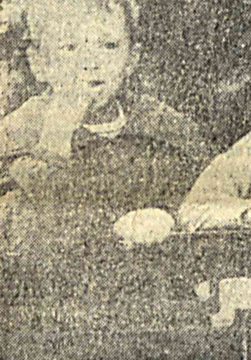
А на заборе весело...