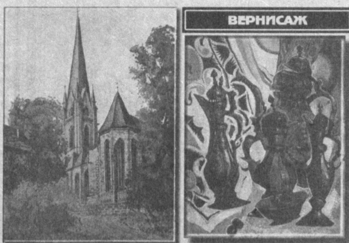
Так называется выставка, открывшаяся в Интернациональном культурном центре Республики Узбекистан при содействии культурного центра немцев 'Wiedergeburt'.