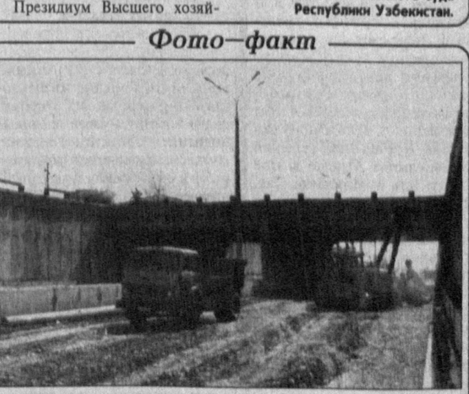
Ташкент превратился в город с интенсивным движением. Надо признать, что наряду с неоспоримыми удобствами в скорости и комфорте передвижения приносящими автомобили, возникли серьезные проблемы с его обслуживанием, защитой окружающей среды от выхлопных газов, безостановочным движением. Для решения этих проблем в городе возведено немало выдувок, благодаря которым не пересыхает движение на оживленных магистралях. Так, за очень короткий промежуток времени были построены транспортные развязки в районе Аланского рынка и первого ТашМЭИ. Очередной такой выдувкой совсем недавно на пересечении улиц Булок и Икити Ф. Ходжаева. Сегодня на этой развязке сосредоточено большое количество техники. Генеральным подрядчиком выступает мостостроитель № 13, именной богатый опыт сооружения подобных объектов. А в роли активных помощников выступают подразделения концерна "Ташгортрустракс", объединений "Узбекивустранс" и "Городстройремонт". Идут полные ходом пусконаладочные работы, вносятся последние штрихи. Еще немного, и по новой дороге промчатся первые машины. НА СНИМКЕ: работы по прокладке новой транспортной развязки.