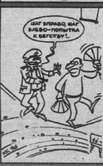
Рис. Вячеслава Капрельянца.