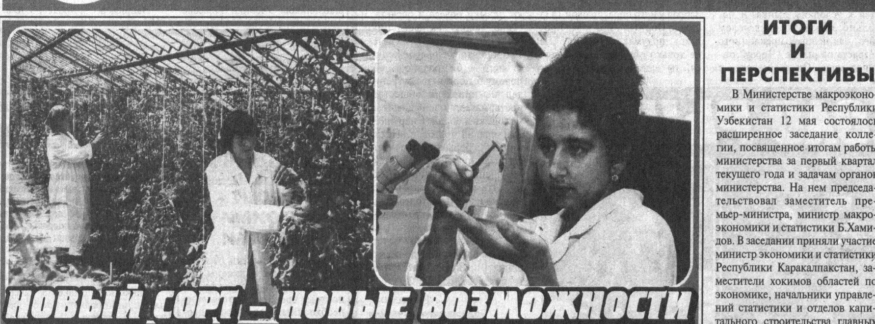
НОВЫЙ СОРТ - НОВЫЕ ВОЗМОЖНОСТИ

Их урожайность составила 35-50 тонн с гектара. Выращены такие сорта помидоров специально для парников, как "Турон", "Аве Мария". На каждом квадратном метре в парниках можно получить по 12-15 килограммов помидоров. Кроме того, в институте созданы ранние сорта перца "Наргиза", капуста, моркови "Нурли", выдерживающих высокую температуру, лука, ранние сорта арбузов "Уринбай", "Манзур". Ученые института больших успехов добились и в развитии семеноводства. Ими разработана специальная технология с использованием микроэлементов для быстрого получения всходов и защищающих их от вирусов.