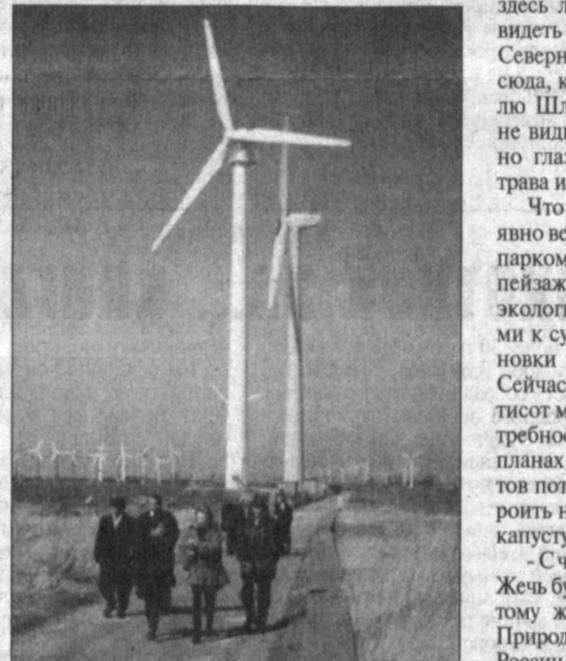
создадим экологический строй, в котором экология станет определять направления развития рыночной экономики".

Этими размышлениями я делюсь не с членами собеседниками, а с земляками, именными делегатами. Они упрекать, что делают сравнения в чужую пользу. Честное слово, не хочется этого делать. И будет здорово, если у нас станут учиться, к нам ездить за опытом... Несколько лет тому назад мне довелось познакомиться в Госкомприроде на общественном обсуждении проекта Пскемской ГЭС. Крест на нем эксперты не поставили, но принятие решения отложили до более глубокого изучения "за" и "про-