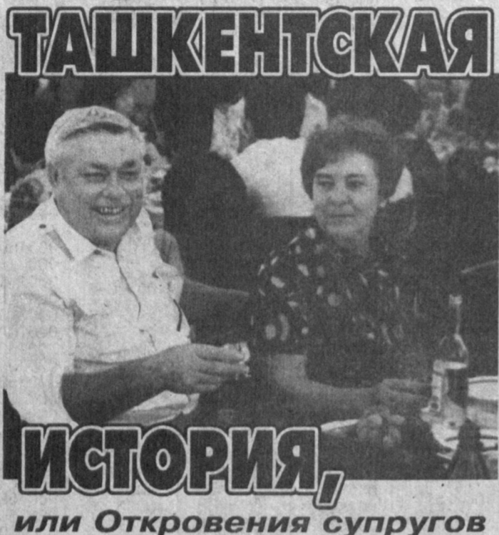
ТАШКЕНТСКАЯ ИСТОРИЯ, или Откровения супругов после свадьбы. Золотой...