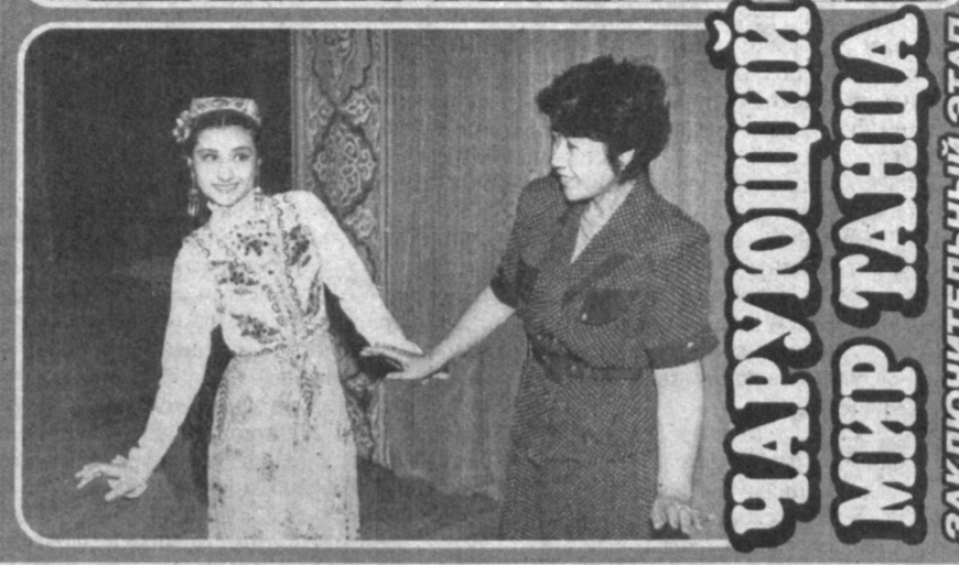
ЧАРУЮЩИЙ МИР ТАНЦА ЗАКЛЮЧИТЕЛЬНЫЙ ЭТАП СМОТРА-КОНКУРСА

В нашей стране все более развивается национальная культура и искусство. Указ Президента Узбекистана о развитии искусства национальной культуры и хореографии в этом отношении является важным программным документом. Созданное на основе этого указа объединение "Узбекракс" ведет плодотворную работу по сохранению развивающегося на протяжении многих веков национального танцевального искусства, сохранению его для будущих поколений. Проведение республиканского конкурса исполнителей национальных танцев имени Мукаррам Турганбоевой вышло еще одним подтверждением внимания к этому древнему виду искусства в нашей стране.