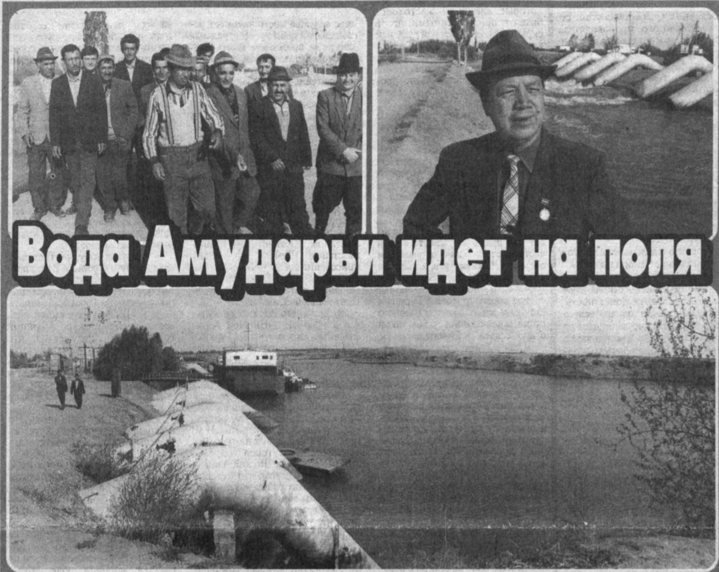
Вода Амударьи идет на поля

Коллективом Берунийской районной насосной станции, а также управлением энергетики и связи сделано немало для обеспечения водой 40 тысяч гектаров посевных площадей Берунийского и Элликкалинского районов. Без перебоев работали все 8 насосных станций и агрегатов. Переход насосных станций управления на электроэнергию дает возможность экономить много горючего. Так, уже перешли на электроэнергию на насосных станциях "Килчинок", 6 агрегатов, "Козючки" - 7 агрегатов. Работа эта продолжается. Это дает возможность сэкономить до конца года 26 млн. сумов. Особого внимания заслуживает работа насосной станции управления "Кызылкум". Здесь с помощью 16