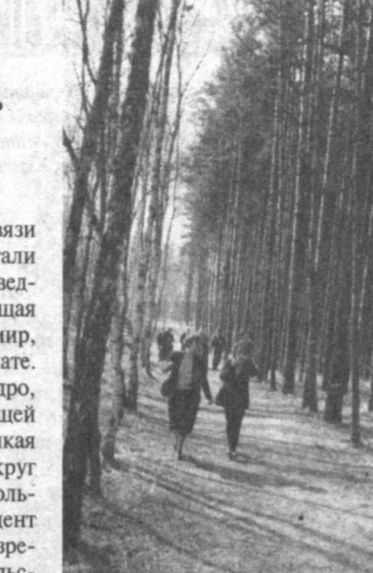
заповедников земли Бранденбург беспокоиться не только об экологии, но и об экономике, судьба тех трех десятков тысяч человек, что живут в Шорфайде-Хорин.

Сельское хозяйство восточной Германии велось неэффективно, а теперь не может выдержать конкуренции. Есть деревни, где безработица достигла 60-70 процентов! Вот и приходится сотрудникам Института крупных