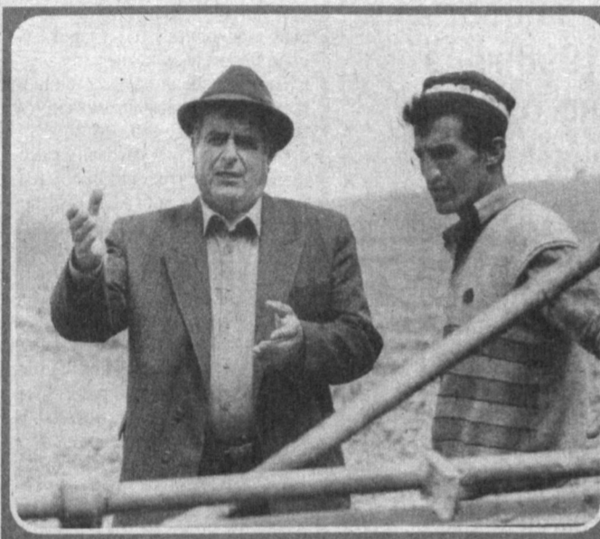
НА ХЛОПКОВОМ ПОЛЕ