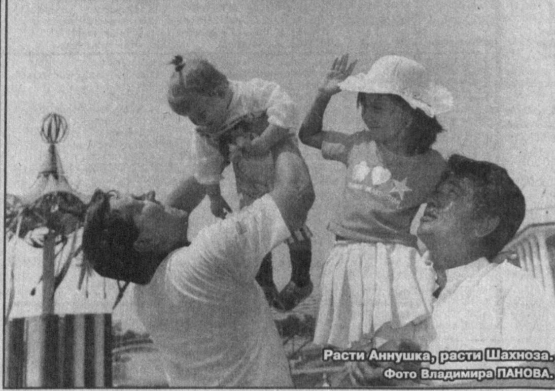
Расти Аннушка, расти Шахноза.