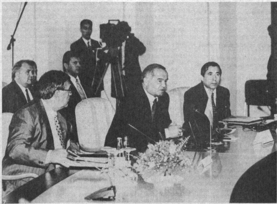
НА СНИМКЕ: во время встреч глав государств тюркоязычных стран в новой столице Казахстана - городе Астана.