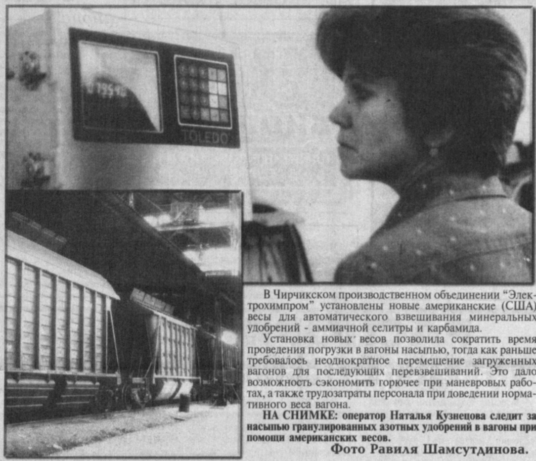
В Чирчикском производственном объединении "Электромаш" установлены новые американские (США) весы для автоматического взвешивания минеральных удобрений...