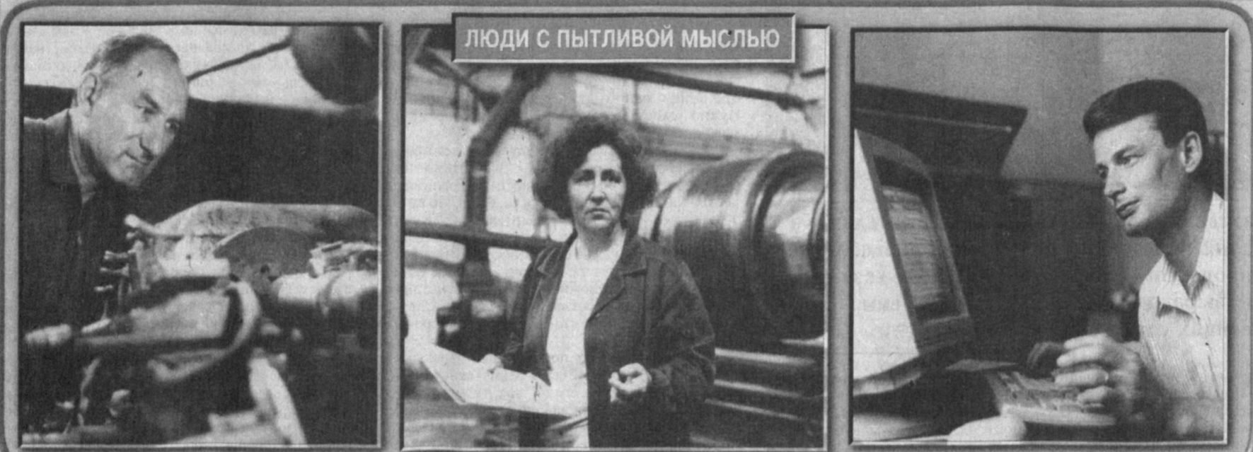
ЛЮДИ С ПЫТЛИВОЙ МЫСЛЬЮ

В производственном объединении "Узжелдорремаш" много внимания уделяется работе с рационализаторами. Только в прошлом году годовой эффект от внедрения внесенных ими предложений составил по предприятию более четырех миллионов сумов.