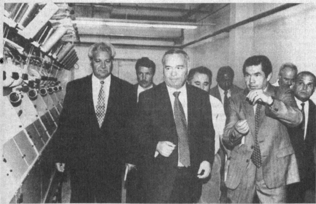
Как сообщалось, Президент Республики Узбекистан Ислам Каримов побывал 18-19 июня в Андижанской и Ферганской областях для ознакомления с процессом реформ в сельском хозяйстве, ходом уборки зерна и выращивания хлопка, внедрения вновь принятых законов, имеющих отношение к этой отрасли.