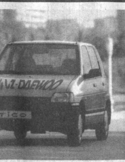
Записал Бахтиер Мадаминнов.

Использование нашей символики производится только с утверждения и разрешения соответствующих служб АО "УзДЭУавто", отвечающих за рекламную деятельность и укрепление имиджа компании.