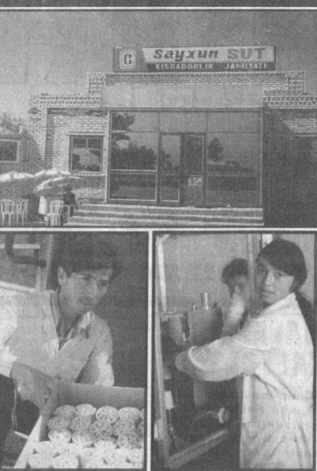
НА СНИМКАХ: на совместном предприятии по выпуску мороженого "Сайхун".

Взяв, по смыслу, такой лозунг за главный призыв к действию, в области собрали предпринимателей и желающих стать ими и попросили вслух или письменно поделиться, производством какой продукции они могли бы заняться. В итоге обсуждения и соответствующего анализа состоятельности того или иного замысла родилась книга, а теперь уже и не одна, в которой собраны главные идеи и предположительные способы их осуществления. А также то, что они могут дать, - новые производства, виды продукции, выгоды... Книжки, достойные прочтения не только будущими предпринимателями, чтобы знать потенциал области: из них можно "вычитать" перспективы ее развития, будущую жизнь поколений. Приоритетное на-