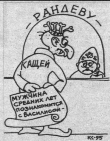
Рис. Вячеслава Капрельянца.

- Ну ладно... Но учти, Яков, увольствия от твоих похорон я не получу.