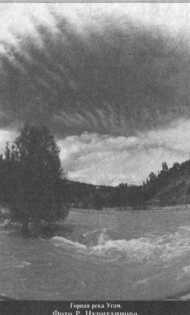
Горная река Угам.