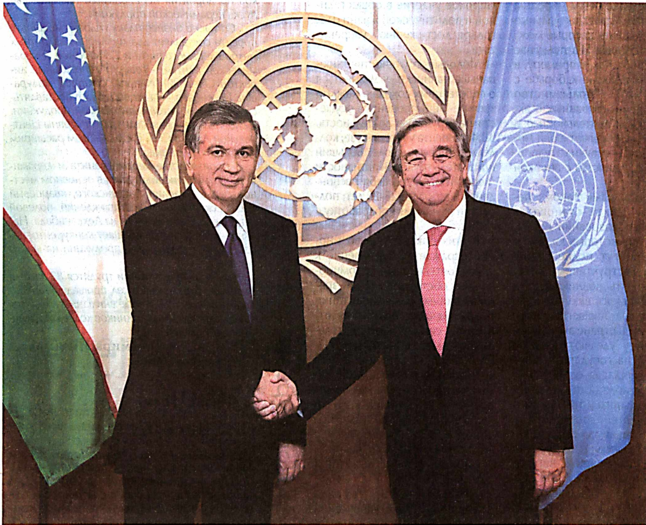
Президент Республики Узбекистан Шавкат Мирзиёев 18-20 сентября посетил Соединенные Штаты Америки.

Президент Шавкат Мирзиёев 19 сентября в штаб-квартире ООН в Нью-Йорке встретился с Генеральным секретарем Организации Объединенных Наций Антониу Гутерришем.