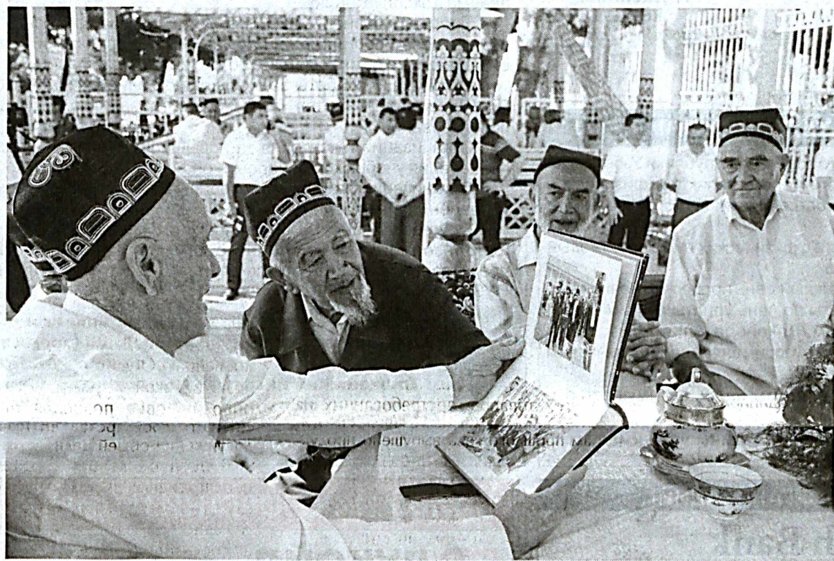
■ В Андижане сдан в эксплуатацию современный комплекс "Нуронийлар маскани".

Учитывая положительные результаты работы камер, в ближайшей перспективе планируется оснастить подобной системой еще дополнительные перекрестки столицы. Второй этап будет реализован в рамках программы "Безопасный город". Решение о расширении системы было принято в связи с эффективными результатами ее деятельности - значительно снизилось число правонарушений на дорогах, число погибших и пострадавших. Кстати, система будет не только расширяться, но и совершенствоваться на основе опыта развитых стран. Оксана Малосабирова.