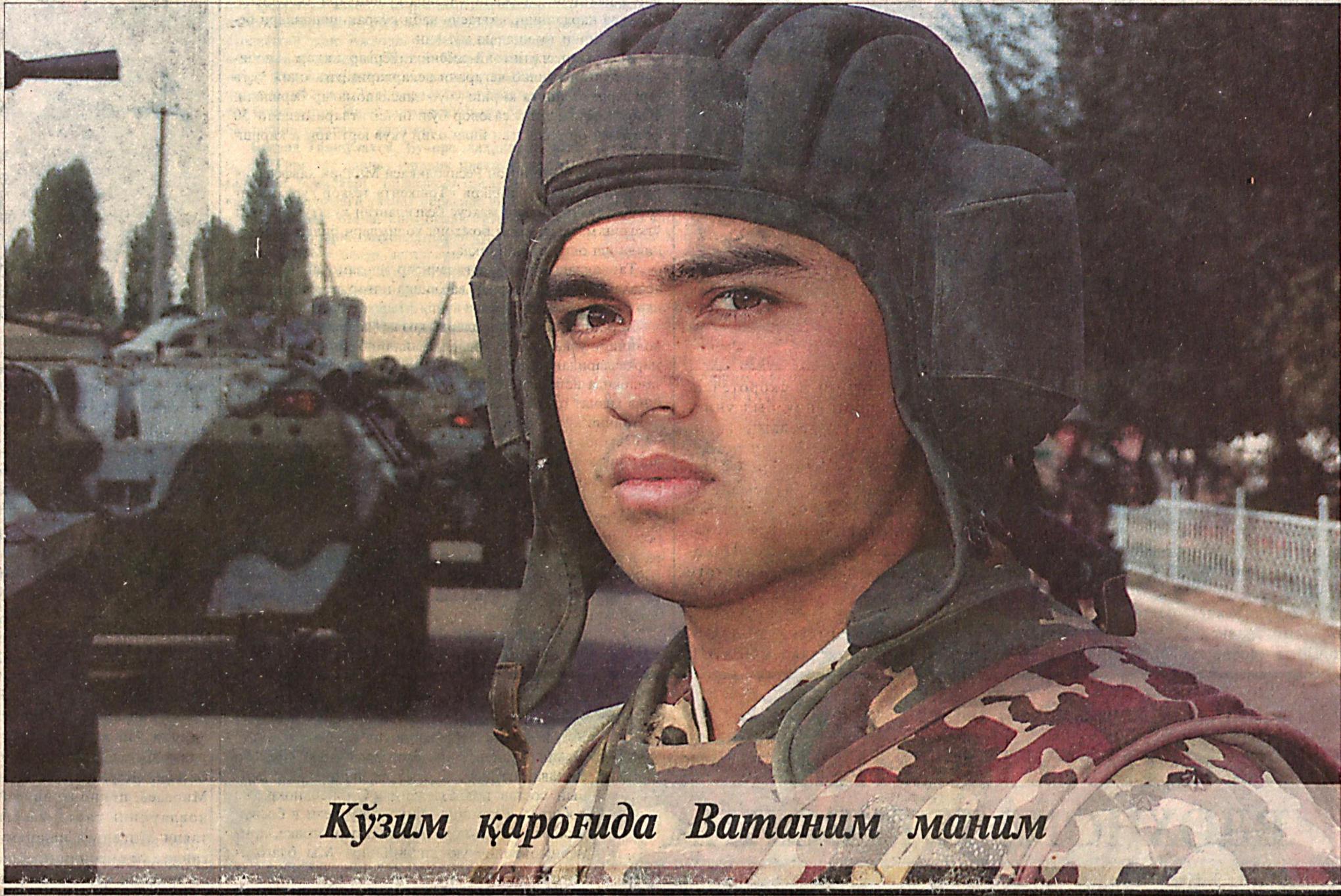
Кўзим қароғида Ватаним маним

Ислом КАРИМОВ, Ўзбекистон Республикаси Президенти.