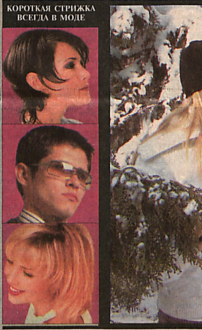
КОРОТКАЯ СТРИЖКА ВСЕГДА В МОДЕ

Ватан ҳимоячилари кун и умумхалқ байрамига тайёргарлик кўриш ва уни ўтказиш борасида Шахрисабз автомобилчилар тайёрлаш мактабида тантанали маросим ўтказилди.