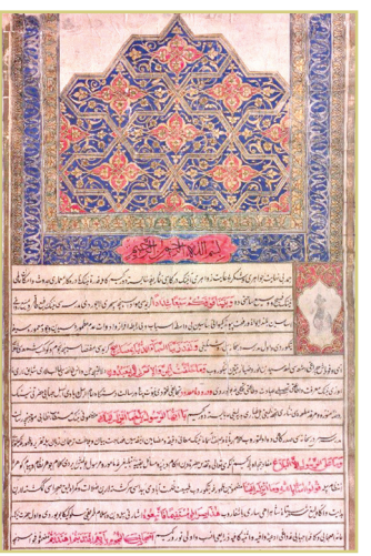
Хива шаҳридаги Муҳаммад Ёқуб бей мадрасасида тегишли мол-мулклар вақфи. XVIII аср. ЎЗР МДА.

— Ноёб фондда Хива хонлигининг маъмурий-худудий жойлашиши, давлат бошқаруви, қишлоқ ҳўжалиги, ҳунармандчилик, савдо алоқалари, халқнинг турмуш тарзи ва маданиятига оид кенг қамровли маълумотлар мавжуд, — дейди Ўзбекистон Миллий архиви директори Дилбар Зокирова. — Ўзбекистон Республикаси Марказий давлат архивига сақланаётган ушбу ҳужжатлар 1268 та йғма жилддан иборат бўлиб, 20 минг варақни ташкил этади. Хива хони Ануш Муҳаммад Баҳодирхоннинг фуқаро мулла Маҳмуд ва унинг фарзандларига берган тархон ёрлиғи фонддаги энг қадимий ҳужжат бўлиб, милодий 1664 йилга тааллуқлидир. Хива хонининг Англия консули билан турли масалалар хусусидаги ёзишмалари 1846 йилга тегишли. Хатда икки давлат