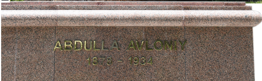
ABDULLA AVLONIY 1875 - 1934