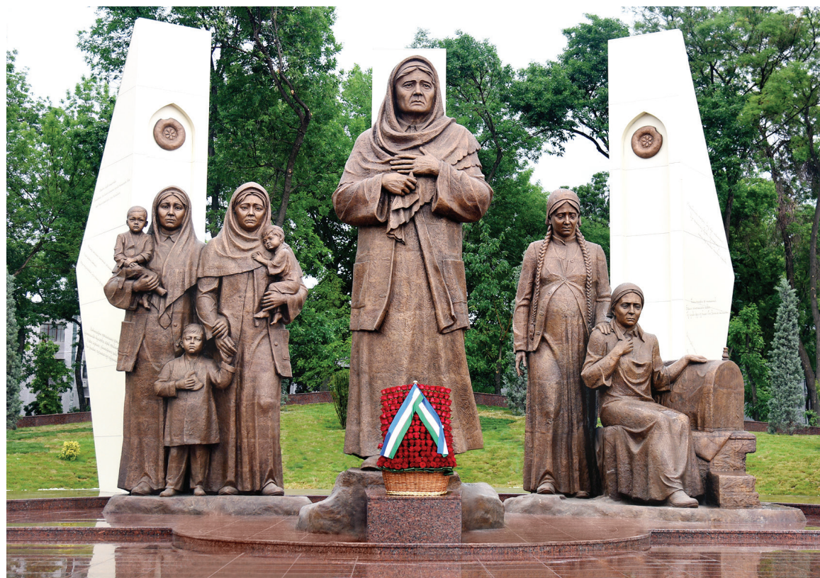
Ўзбекистон Республикаси Президенти Матбуот хизмати суратлари.