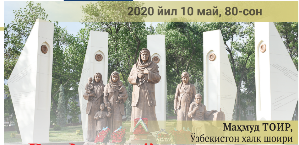
Маҳмуд ТОИР, Ўзбекистон халқ шоири

Азиз умримизнинг азиз оилари, Азиз одамлардан сўрайди қадри. Фурсат ганшамандир шох сатрлар-ла, Бозалоқ чоғидир умр дафтари.