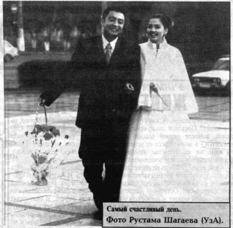
Самый счастливый день.