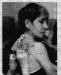
НА СНИМКЕ: последний штрих.