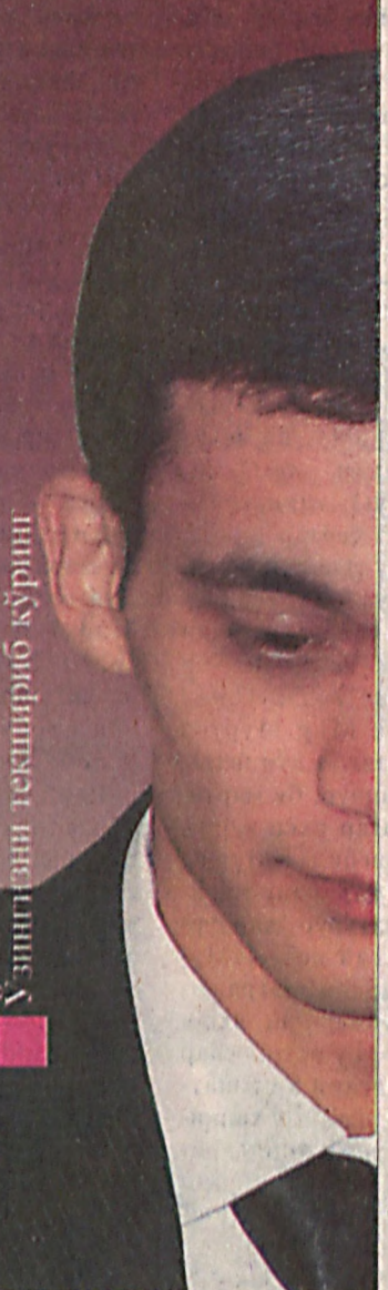
Ўзингизни текшириб кўринг

Осмонга устундир гўзал, кўркам миноралар!