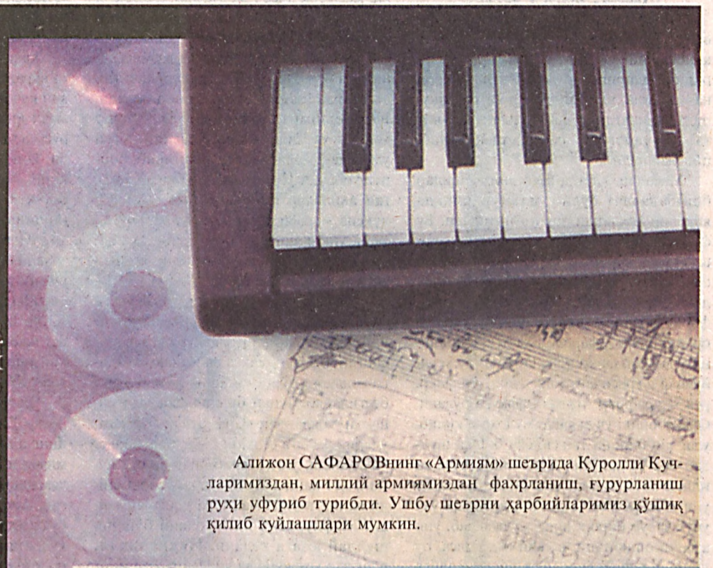
КЎШИҚЛАРДА ВАТАН МАЎЖИ