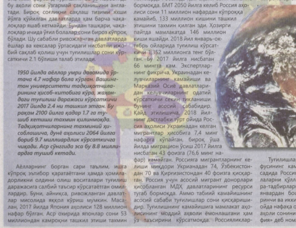
Абдували СОЙБНАЗАРОВ, сиёсий шарҳловчи