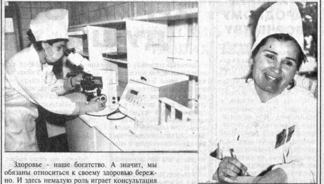
Здоровье - наше богатство. А значит, мы обязаны относиться к своему здоровью бережно. И здесь немалую роль играет консультация врача.

Сейчас в Ташлакском районе насчитывается 12 сельских врачебных пунктов. Так, сельский врачебный пункт в кишлаке Суфиляр обслуживает более 8 тысяч жителей. Пункт обеспечен необходимым медицинским оборудованием. А главное,