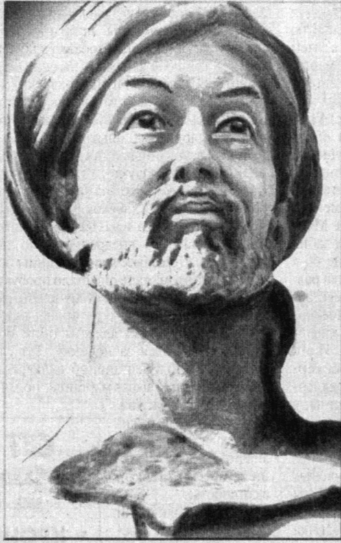
Знакомство с произведениями Джами. Полное издание этого сочинения имеет научное, просветительское и духовное значение.

В прежнем издании 1968 года содержались сведения лишь о 153 шейхах и пропущены некоторые религиозные и мистические термины. «Насойим ул-мухаббат» - перевод произведения Абдулхамана Джами «Нафахот ул-унс мин хазарот ил-хула». Но Навои творчески подошел к работе своего учителя, дополнил, а местами сократил