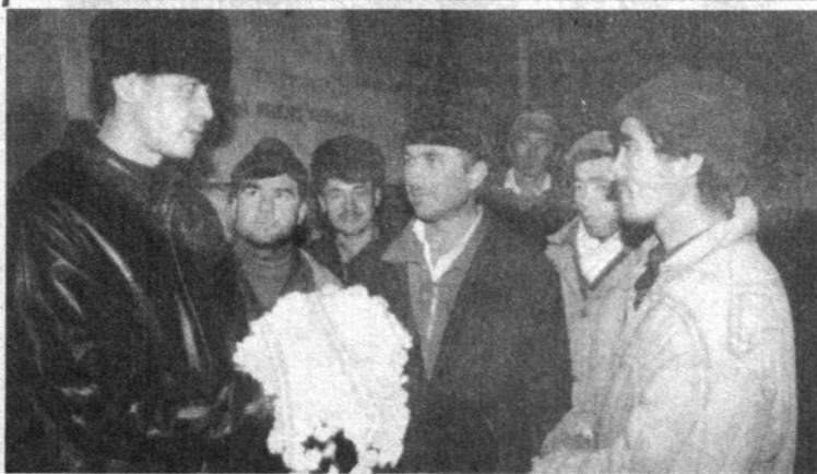
Всего два года тому назад начал выдавать продукцию Вабкентский хлопкоочистительный завод. Однако, несмотря на такой незначительный срок, предприятие заняло достойное место в объединении «Бухаролахтасаноатсотиши». Его мощность - 35 тысяч тонн хлопка в год. Трудятся здесь 170 человек. 98 процентов высококачественного волокна отправилось за рубеж. С большой охотой покупают продукцию Вабкентского завода швейцарская фирма «Дановант», итальянская «Индутек», корейская «ДЭУ». Часть полученной прибыли предприятие расходует на благотворительные цели. Так, например, на развитие тенниса, футбола, реконструкцию школы в районе. Миллионы сумов выделены на благоустройство гробницы Хожа Анжир Фагъавий.