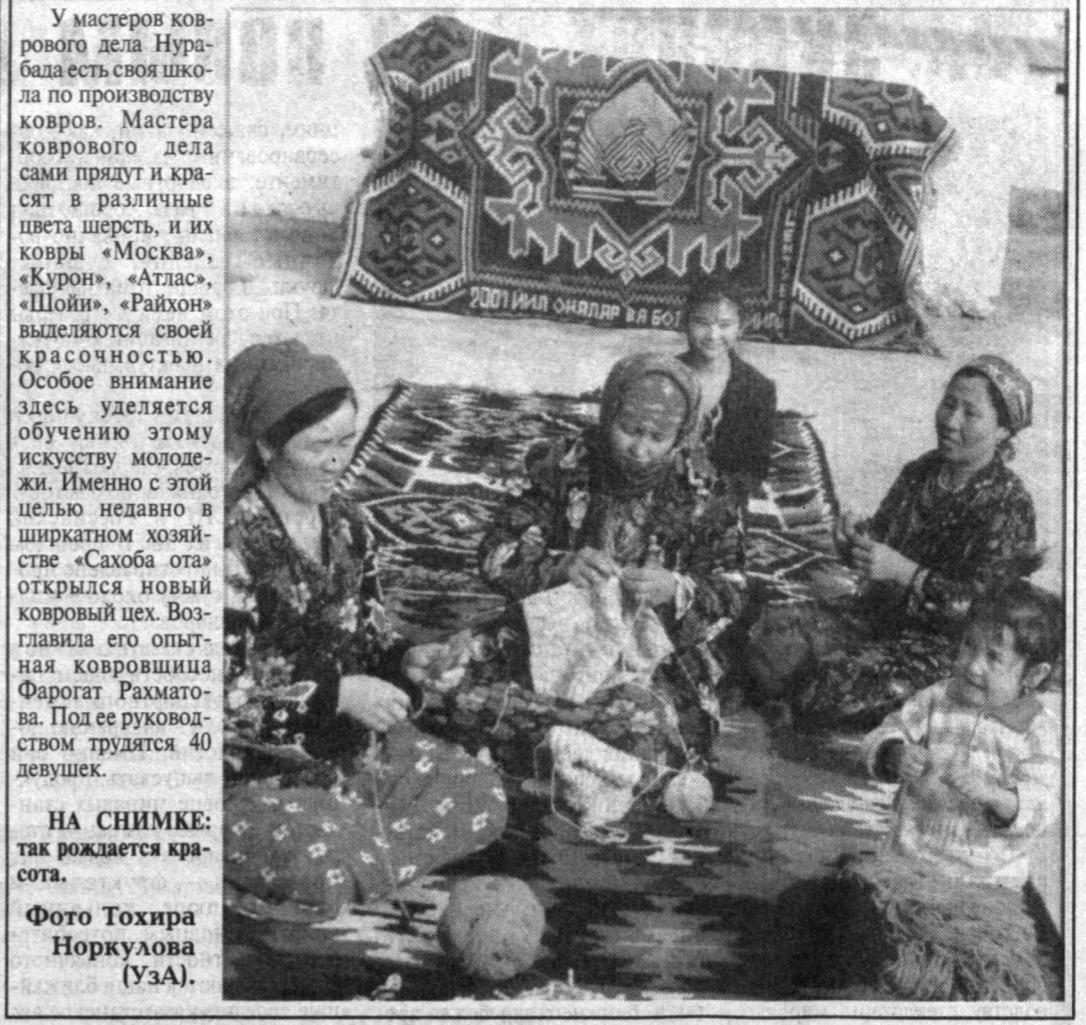
НА СНИМКЕ: так рождается красота.