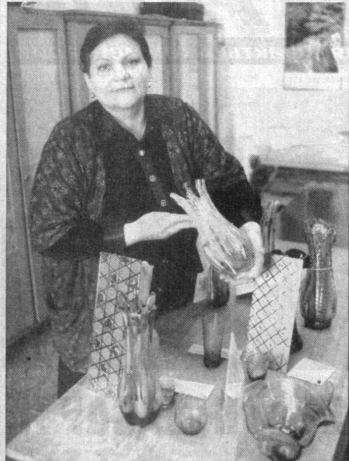
Газалкентский стекольный завод ОАО «Газалкентойна» выпускает разнообразную продукцию. Основной ассортимент предприятия - товары широкого потребления - изящные вазы из цветного стекла, бокалы для напитков, декоративные стекла-витражи и другая продукция.