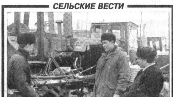
Деятельно готовятся к весенне-полевым работам дехкане ширкатного хозяйства «Волид» Ферганского района. Особое внимание здесь уделяется ремонту техники. Уже качественно отремонтированы 28 протрашних тракторов и 19 сеялок.

УЧРЕДИТЕЛЬ - КАБИНЕТ МИНИСТРОВ РЕСПУБЛИКИ УЗБЕКИСТАН