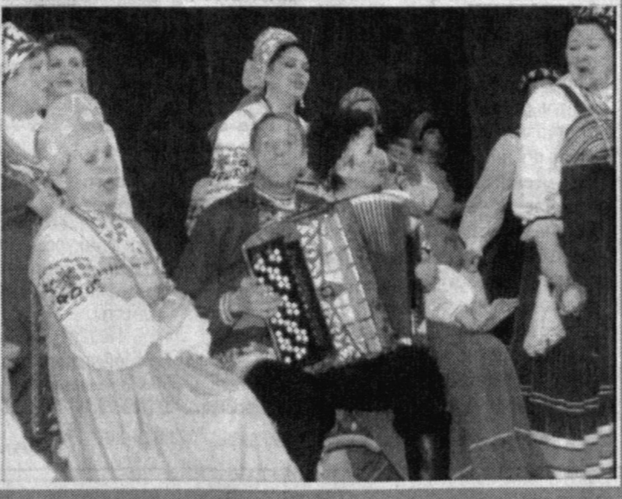
Олеся Хайрутдинова. НА СНИМКЕ: на сцене Дворца музыки выступает ансамбль «Калинушка».

Особое внимание администрации дворца и дирекции Национального симфонического оркестра уделяют подготовке программ для юной аудитории. Формируется отдельный концертный репертуар, сопровождаемый грамотными комментариями лектора, рассчитанными на понимание маленького зрителя. Для взрослой аудитории наш репертуар представляет несомненный интерес, и посещает его немалое количество слушателей. В не меньшей степени и