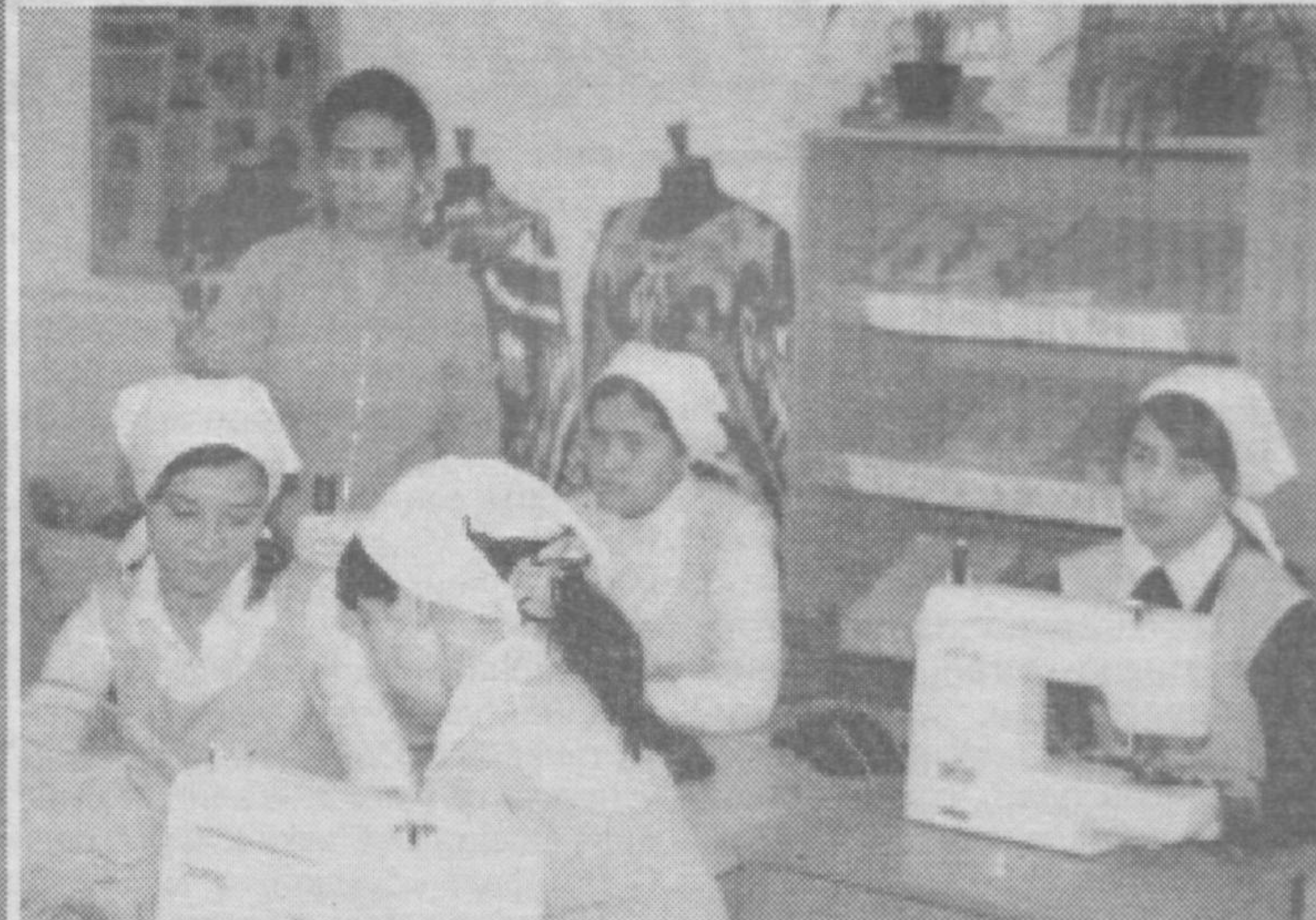
Мамлакатимизда ёшларга касб-ҳунар ўргатиш борасида кенг камровли ишлар амалга оширилмоқда. Пойтахтимиздаги энгил саноат касб-ҳунар коллежида ҳам тикувчилик, бухгалтерия, халқ истеъмол буюмларини моделлаштириш, бичувчилик ва компьютер саводхонлиги бўйича илмий-амалий машғулотлар олиб борилади. Ўтган ўқув йилида 136 нафар битирувчининг 131 нафари иш билан таъминланган. Суратларда: коллеж ҳаётидан лавҳалар акс этган.