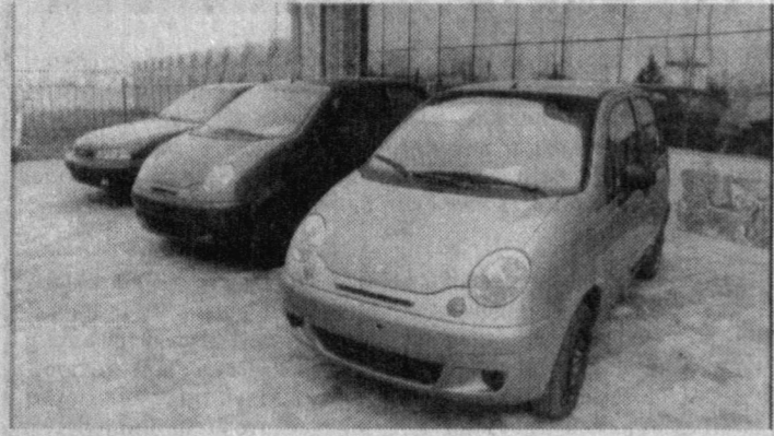
НА СНИМКАХ: автомобили, выставленные на продажу; технический осмотр автомашин.

Значительных успехов в минувшем году добились члены Нукусского акционерного общества открытого типа «Каракалпокатеххиммат». В течение года здесь отремонтированы 7645 автомобилей. Полностью задействованы новые цеха, которые сланы в эксплуатацию, а у работников есть возможность стажировки и повышения квалификации в Южной Корее в корпорации «ДЭУ». Машины, подлежащие продаже, здесь проходят технический осмотр бесплатно.