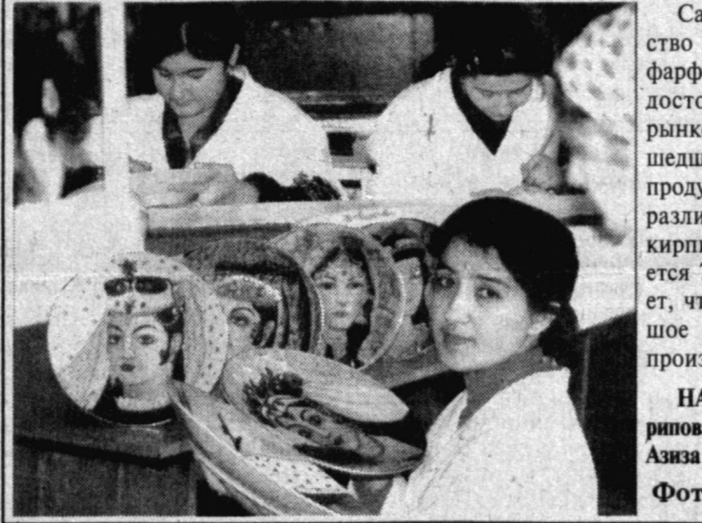
Самаркандское акционерное общество «Нафис» выпускает прекрасные фарфоровые изделия, которые заняли достойное место на международном рынке. Коллектив предприятия за прошедшие два месяца этого года произвел продукцию на 10 миллионов сумов. Это различные плиты, электроизоляторы, кирпич, а фарфоровых изделий выпускается 72 различных наименования. Радует, что на предприятии уделяется большое внимание качеству, повышению производительности труда.

х/ Курсы установлены без обязательства Центрального банка Республики Узбекистан покупать или продавать валюты по данному курсу.