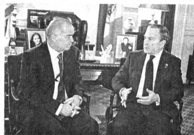
Его Превосходительству господину Исламу Каримову, Президенту Республики Узбекистан...