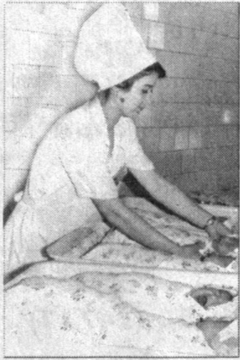
Родильный дом, расположенный в центре Ташкентского района, рассчитан на 50 мест. Здесь за здоровьем рожениц следят более 80 медицинских работников.