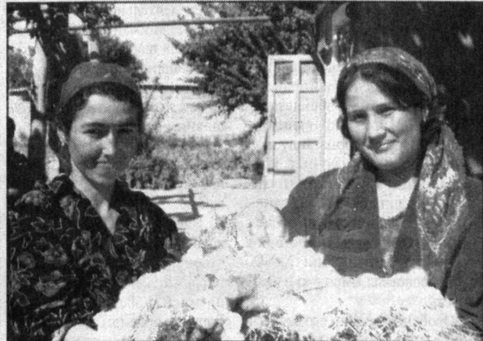
В нынешнем году шелководы Ангорского района планировали с каждой коробки грены получить по 44 килограмма коконов. Благодаря добросовестной и эффективной работе показатели достигли 55 килограммов. Весомых успехов достигли шелководы ширкатного хозяйства "Мустакилик". В хозяйстве выращивают 350 коробок грены и намерены получить 16 тонн ценной продукции.