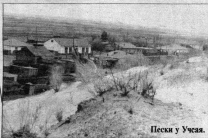
Пески у Учсай.