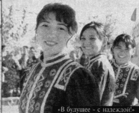
«В будущее - с надеждой!»