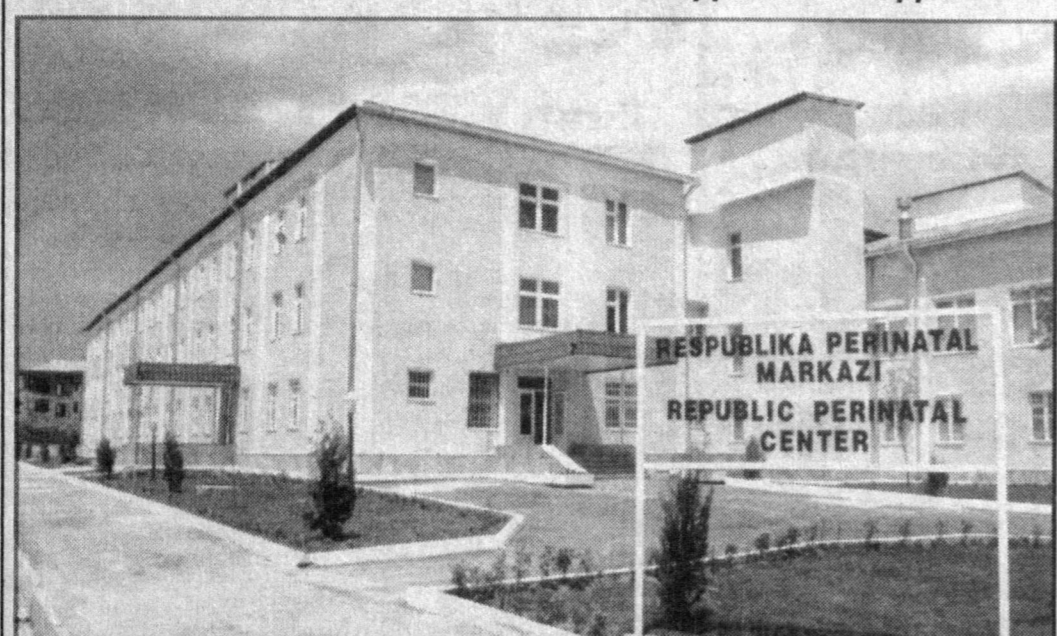
РЕСПУБЛИКА ПЕРИНАТАЛ МАРКАЗИ REPUBLIC PERINATAL CENTER