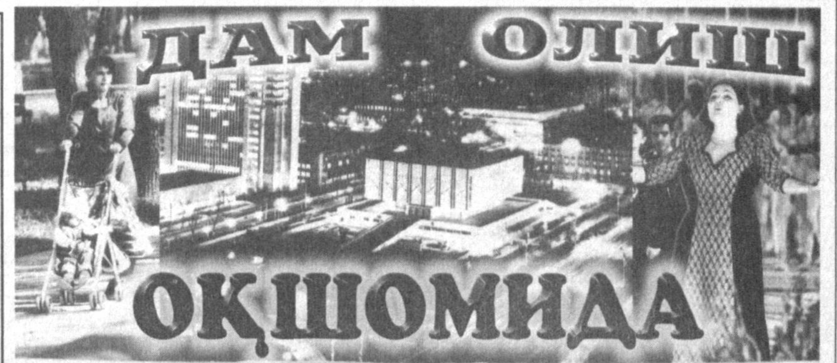
«Оқшомда» дастлабки эфирининг асосий қисмида

Энди Хотамнинг иккинчи савол учун жаҳон паймолига ва сафарда ҳадис оғзақлар ва бениҳоят жоду ва найрағлар билан урғашиб, аларга қилган муомалаларидин эшитинг.