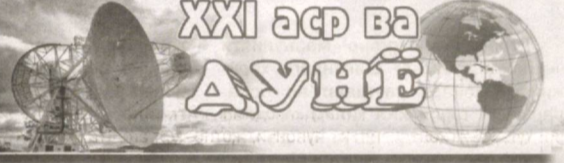
(Давоми. Бошланиши 1-саҳифада)

Мазкур маҳалла фуқаролар йиғинида эндигина иш бошлаган теннис спорт комплекси, меҳнат қаҳрамони Хван Гим музейи иштирокчиларда катта таассурот қолдирди. Гуруҳ аъзоларига, айниқса, байрам муносабати билан