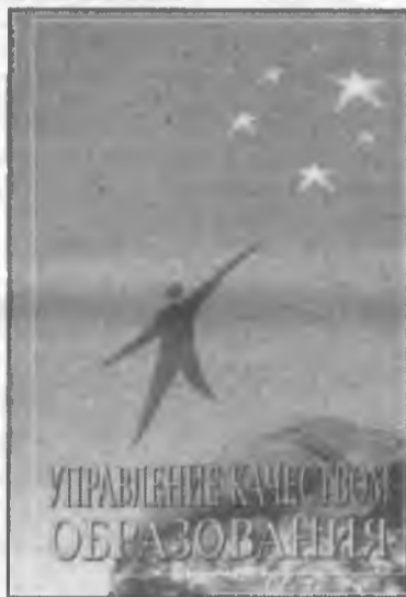
УПРАВЛЕНИЕ КАЧЕСТВОМ ОБРАЗОВАНИЯ

Накануне 13-й годовщины независимости Республики Узбекистан вышла в свет новая книга, посвященная одной из важнейших проблем, стоящих перед обществом на этапе коренного реформирования системы образования, - проблеме повышения качества образования и управления этим процессом.