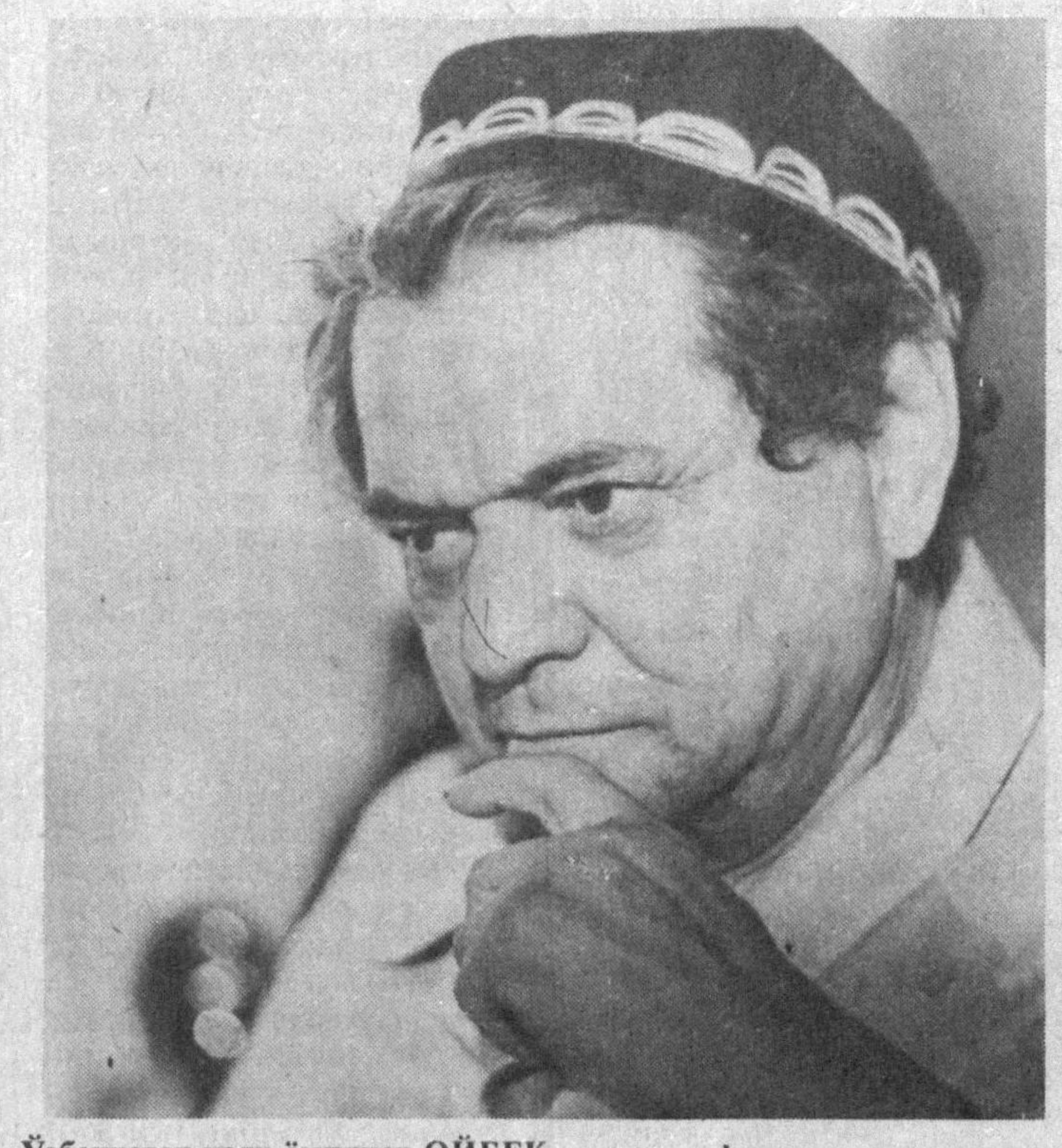
Ўзбекистон халқ ёзувчиси ОЙБЕК

Собиқ шуролар тузуми даврида ҳамма бир хил қўшиқни, бир хил услубда, бир тилда ижро этарди. Болалар: «Ўқинг аъло, бўлинг доно», катталар эса: «Манзилимиз Совет Иттифоқи» қўшиқларини қайта-қайта айтишдан чарчамасди. Бу зўриқ билан сатгилдирган анъана бошқа хил-қилларнинг уз юрти, Ватани ҳақида куйлашни бир қалар ҳақида куйган эди. Энди уша гаддор тузум ҳам, унинг уткинчи қўшиқлари ҳам йўқ. Ўзбекистон уз мустақиллигига эришгандан сунг Ватан, Озолик, Истиқлол ҳақида ажаблиқ қўшиқлар янграй бошлади. Чунки мустақил юртин юракдан ёниб куйлаш халқимизнинг азалий ва асрий орузи эди. Мустақиллик туфайли бу азиз Ватанин, унинг бебаҳо халқи ва тупроғини ҳар қанча куйласак, ҳар қанча тараннум этсак, камлик қилмайди.