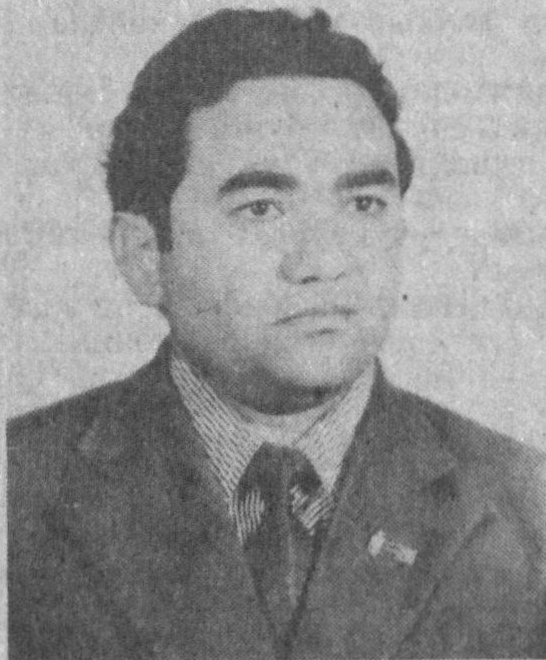
Шунга ҳам йигирма йилга авуқлашибди. Топшўлат аҳо ўшанда ўттининг нари-Бери-сида эди. Бироқ Бухорода у киши ўзига хос обрў орттирган, кўпларга устоз бўлиб улгурган, балки шунинг учун-дирки, кўпчилик у кишини «ака» дер эди.

Алишер Навоий эллик ёшнинг қорилик деб ҳисоблайди. Унинг бир газадида шундай байтлар бор: Эй кўнгул, тут гўша... Эмди ибодат қилгани, Қолмоқ истар бўлсанг, эллик йилги бўлган хурматим.