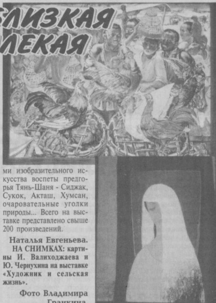
Наталья Евгеньевна. НА СНИМКАХ: картины И. Валюхаджава и Ю. Черлухина на выставке «Художник и сельская жизнь».

Наряду с полотнами Р. Ахмедова, Р. Чарыева, С. Рахметова и других мэтров отечественной живописи здесь выставлены работы их молодых коллег. Каждый из них находит теплые краски, линии и формы, чтобы передать облик человека-труженика, нелегкий ритм сельских будней. И все это - без ложного пафоса, с искренней любовью к землякам. Средства