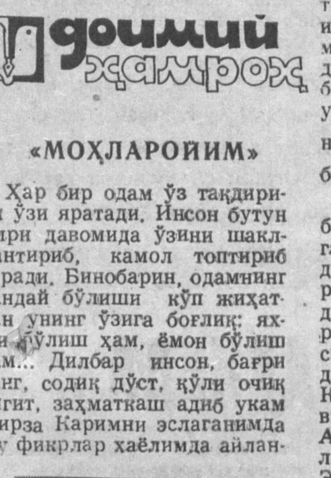
МИРЗА КАРИМ Моҳларойим

ди, Чунки мен билган Мирза Карим умри давомида ҳаминша яхшиларга эргашди. Ҳа, унинг яхши инсон сифатида шаклланиши учун яшилди. Бунинг унинг баган мақолалари, китобларидан ҳам билса бўлади. Мирза Карим одамнинг кўнглига жуда қарайдиган ҳождатбарор йиғит эди. Айтайлик, бировга ишигиш