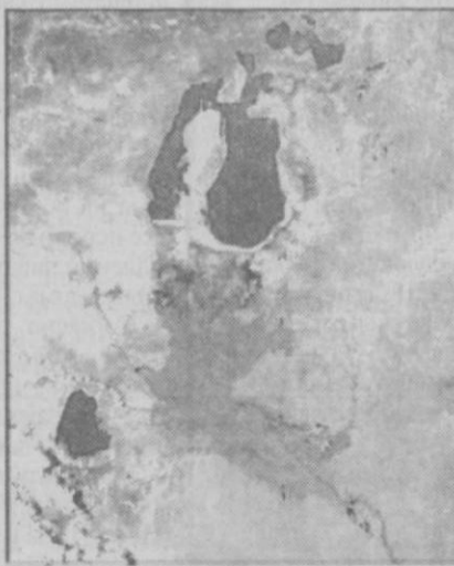
Космоснимок 2001 года, худшего для Арала и дельты.

Ей предстоит выполнить работ на 1,8 млрд сумов. А именно: построить на Междуреченском водохранилище водосборной регулятор для пропуска 360 кубов в секунду, реконструировать на этом же водохранилище дамбы обвалования длиной в полсотни километров и двухкилометро-