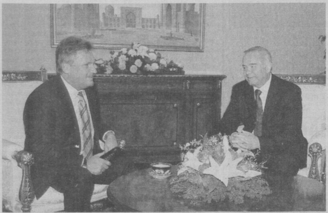
Президент Республики Польша Александр Квасневский с супругой в ходе визита по странам Юго-Восточной Азии 21 февраля сделала остановку в Ташкенте. В недавнюю реконструированном аэропорту «Ташкент-2» высокого гостя и его супругу встретили Президент Республики Узбекистан Ислам Каримов с супругой.

В зале приемов аэропорта состоялся перерыв переговоров президентов двух стран. Ислам Каримов и Александр Квасневский обменялись мнениями по актуальным вопросам, касающимся узбекско-польских отношений, обсудили интересные стороны международных проблемы.