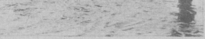
Видно, день для рыбалки не подходил: дул северо-восточный ветер, и была небольшая облачность. Оставалась слабая надежда, что на закате рыба немного «расшевелится». Терпение и оптимизм - это две основные черты, без которых немислдя настоящих рыболов. Уже собрался уходить, как вдруг справа замечаю большие круги, а над ними - блестящие выпрыгивающие из воды мальков. Жерех! Это он, разбойник, гонится за мелочью. Мощным взмахом пускаю блесну чуть дальше центра круга. С первого же заброса - рыбок. Спусти несколько минут крупный красноперый и красногубый аральский жерех лежит у моих ног. Через некоторое время вытаскиваю еще двух красавцев. Мой спутник тоже вытаскивал четырех жерехов, да еще на удочку успел поймать плотвичку и одного сазанчика. Салок с рыбой привязали за колышек и опустили в воду. Мы - с уловом. Душистую уху ели, когда на небе показались первые звезды. У ночного костра время летит быстро. Только далеко за полночь влезли в спальные мешки. Было слышно, как под берегом тихо всплескивает вода, будто большая рыба лениво бьет хвостом. Утром поднялись до рассвета. Да и кто из истинных любителей рыбной ловли пропустит утреннюю зорьку. Не иду, а бегу на свое уютное место. И

красавцев. Мой спутник тоже вытаскивал четырех жерехов, да еще на удочку успел поймать плотвичку и одного сазанчика. Салок с рыбой привязали за колышек и опустили в воду. Мы - с уловом. Душистую уху ели, когда на небе показались первые звезды. У ночного костра время летит быстро. Только далеко за полночь влезли в спальные мешки. Было слышно, как под берегом тихо всплескивает вода, будто большая рыба лениво бьет хвостом. Утром поднялись до рассвета. Да и кто из истинных любителей рыбной ловли пропустит утреннюю зорьку. Не иду, а бегу на свое уютное место. И