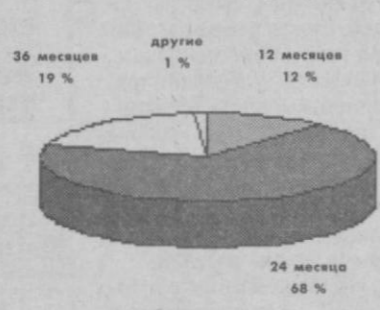
Классификация облигаций по сроку обращения

График показывает, что 68 процентов выпущенных корпоративных облигаций имеют срок обращения 24 месяца, 19 процентов - 36 месяцев, 12 процентов - 12 месяцев и оставшийся 1 процент - 3 до 9 месяцев.