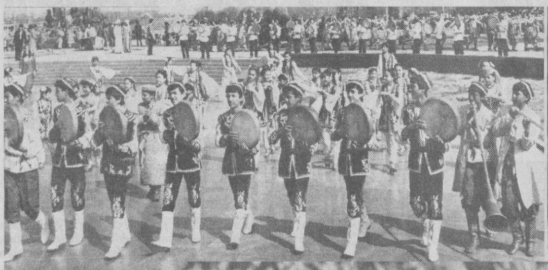
Благословен, священный и по-особому радостен праздник Навруз, пришедший к нам из глубины веков и символизирующий собой обновление природы, утвердившийся как сим жизни на нашей древней земле.

Не одну тысячу лет народы, населяющие Переднюю, Среднюю и Восточную Азию, ежегодно отмечали Навруз как праздник весны, праздник пришествия нового года. Шли века, одна религия сменяла другую, однако Навруз, как и день равноденствия, оставался неизменным. Он вселял в людей уверенность в том, что природа всегда права. Проклятия природы и в том, что она создала человека для торжества жизни. И люди во все времена следовали своему природному естеству, стараясь жить полнокровно, отдавая дань веселью и радости.