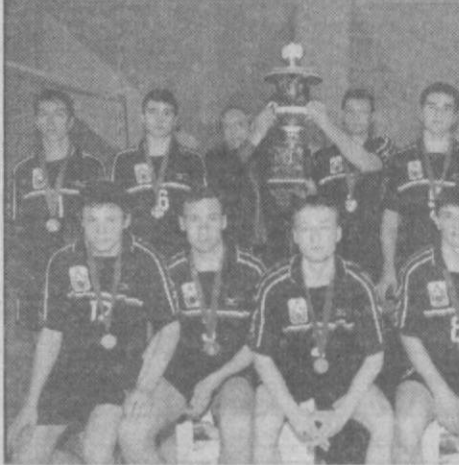
Командам в любительском уровне, трудно будет удержать завоеванные позиции.

Хватит ли возможностей только института, чтобы единственный клуб Намангана и в дальнейшем прогрессировал, не остается «калимом на час» без поддержки других спонсоров? Не будучи профессиональной