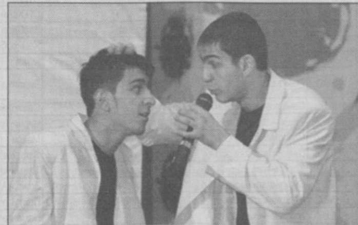
Участники фестиваля КВН.

В «сотворение мира» немалую лепту внесли «ВИА ГРА» и Валерий Мелаззе. Коллектив, представляющий Бекабадский металлургический комбинат, названный, думаю, с глубоким смыслом «Мет.Ко», изобразил этот квартал на закате их пещерной деятельности. Было очень впечатляюще. А вот «Мид-овцы, иначе «Малышки и Девочки» из столичного института востоковедения решили поместить поющих нимф в обычную ванну. Не стоит фан-